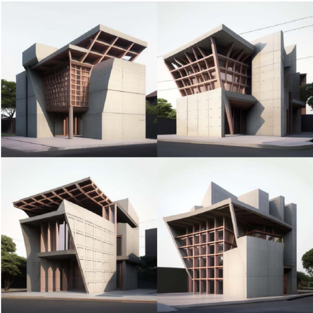
形式特徵混合 (/Blend)，產生兩者兼具的新設計品種